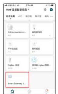
成功後將於主頁面顯示