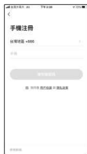
使用「手機號碼」或「電子信箱」註冊