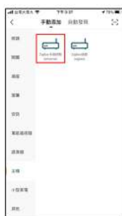
選擇主機 Zigbee有線網關