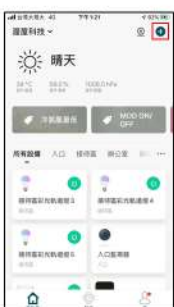
選擇右上角 添加設備