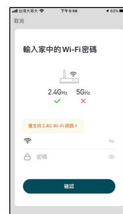
將手機連接Wi-Fi 須與裝置相同網域