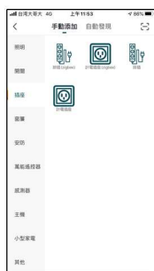
選擇插座 計電插座