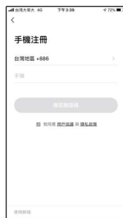
使用「手機號碼」或「電子信箱」註冊