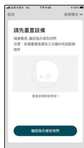
確認指示燈在快閃