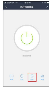
計時器功能 插座將於計時結束後開啟/關閉