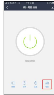
查看歷史統計電量